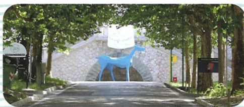
イタリアの精神医療改革のシンボル青い馬